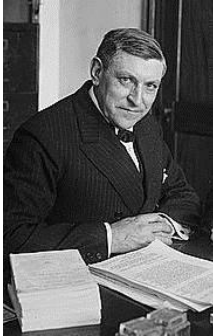
Justice Owen J. Roberts