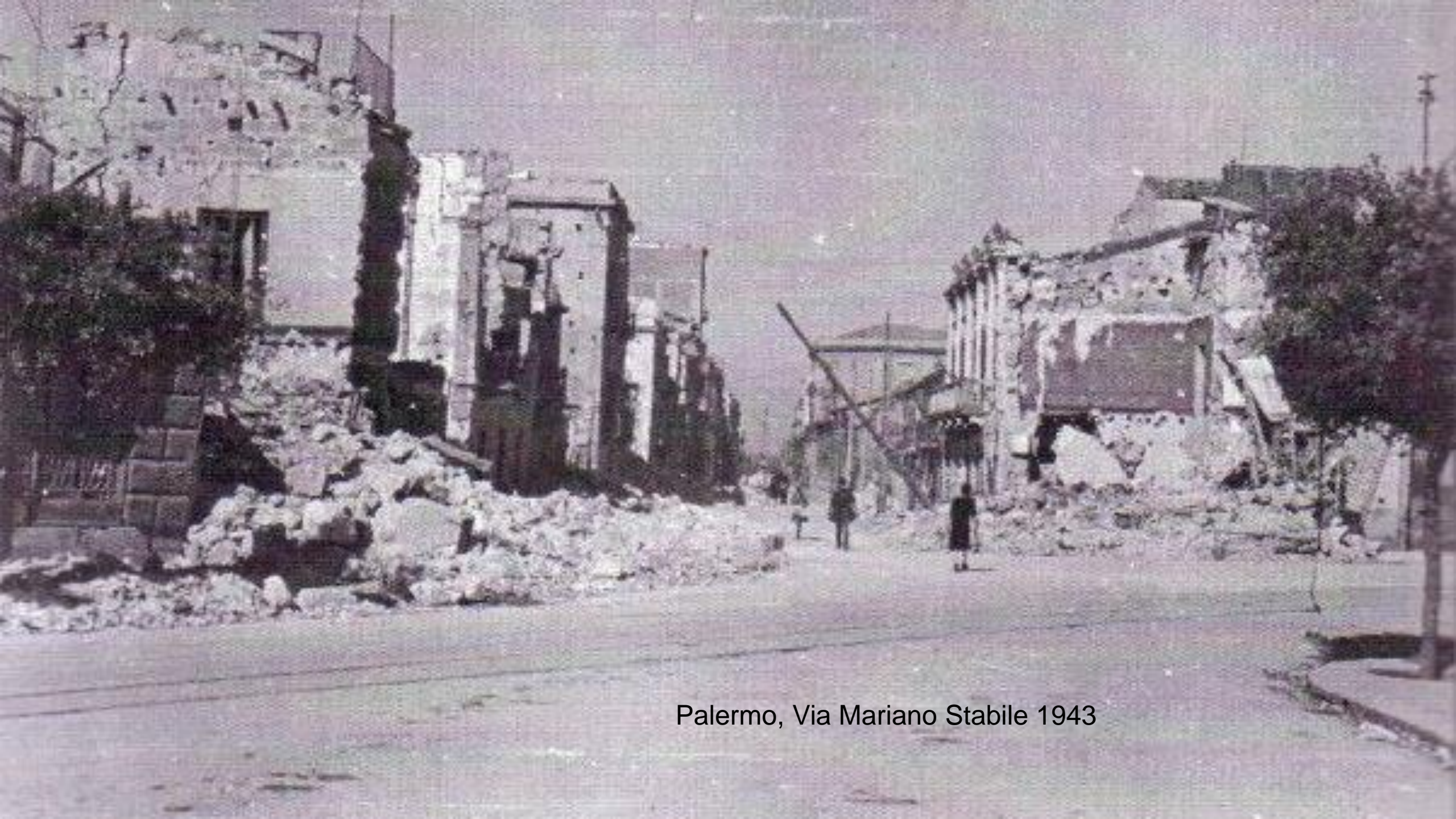
Palermo, Via Mariano Stabile 1943