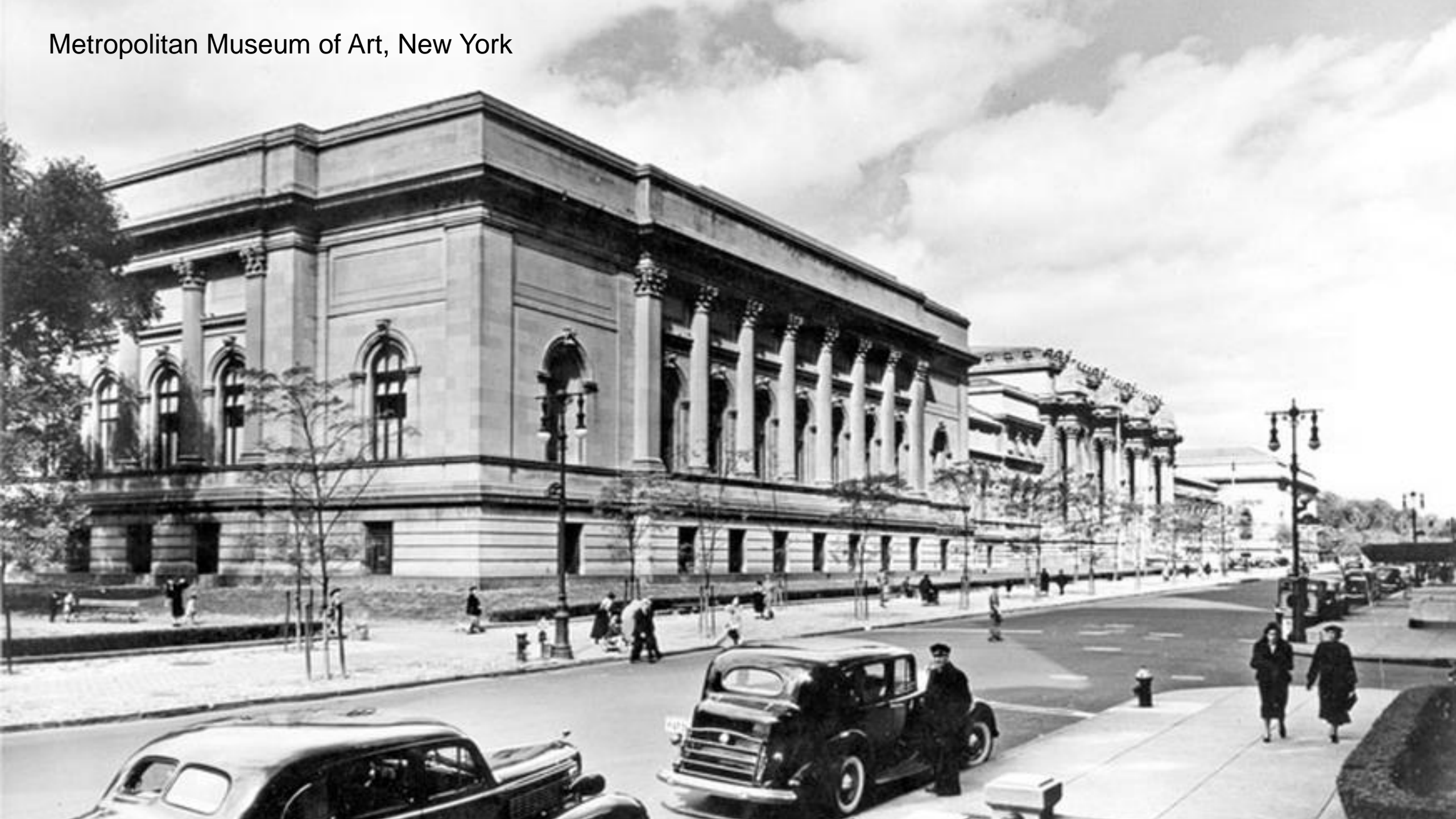
Metropolitan Museum of Art, New York