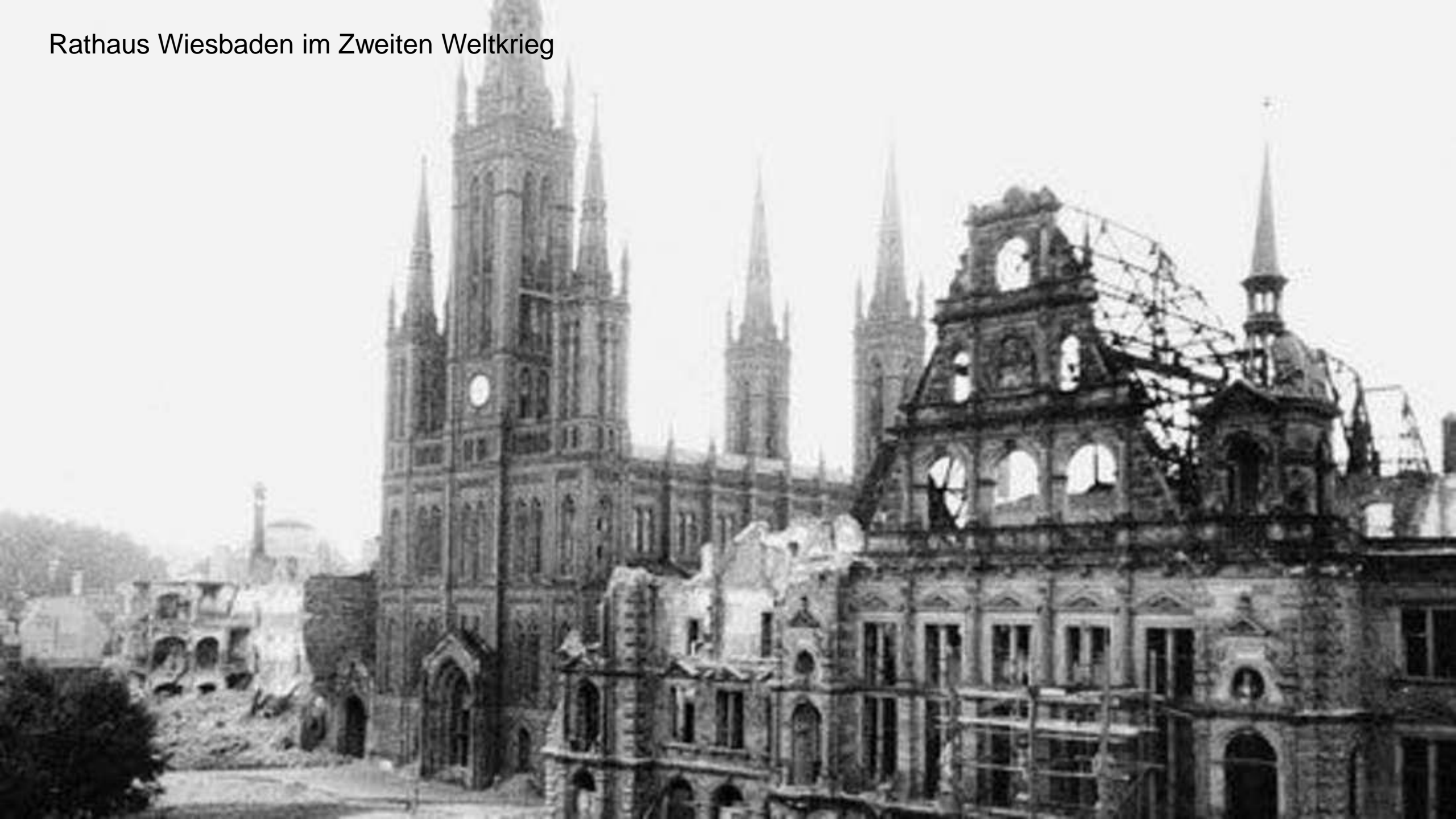
Rathaus Wiesbaden im Zweiten Weltkrieg